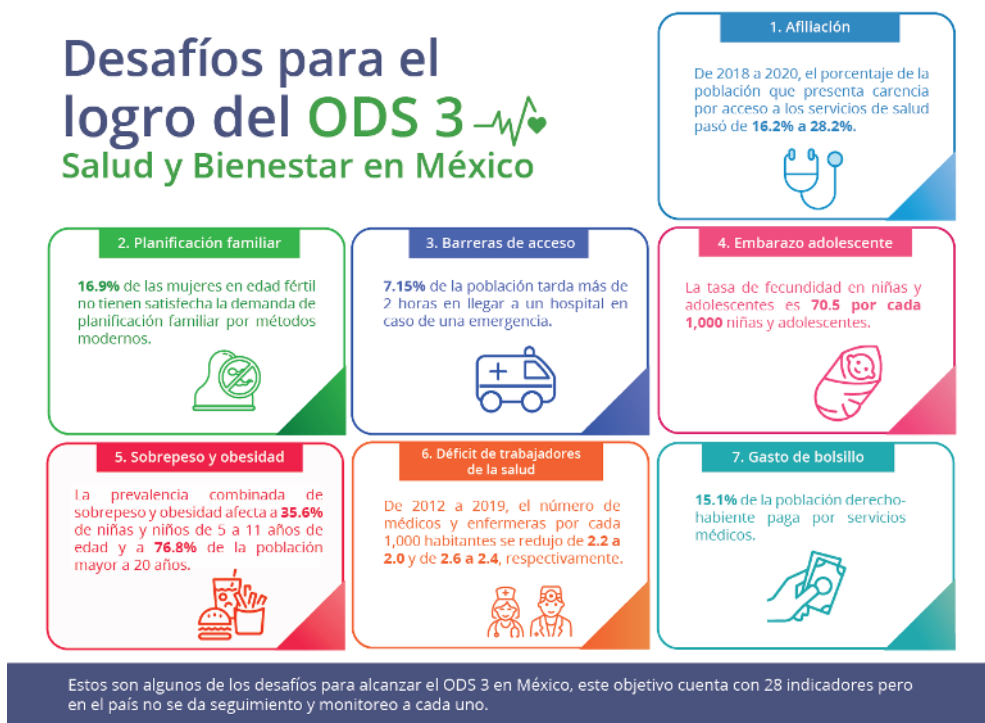
Figura 2: Desafíos para el desarrollo sostenible